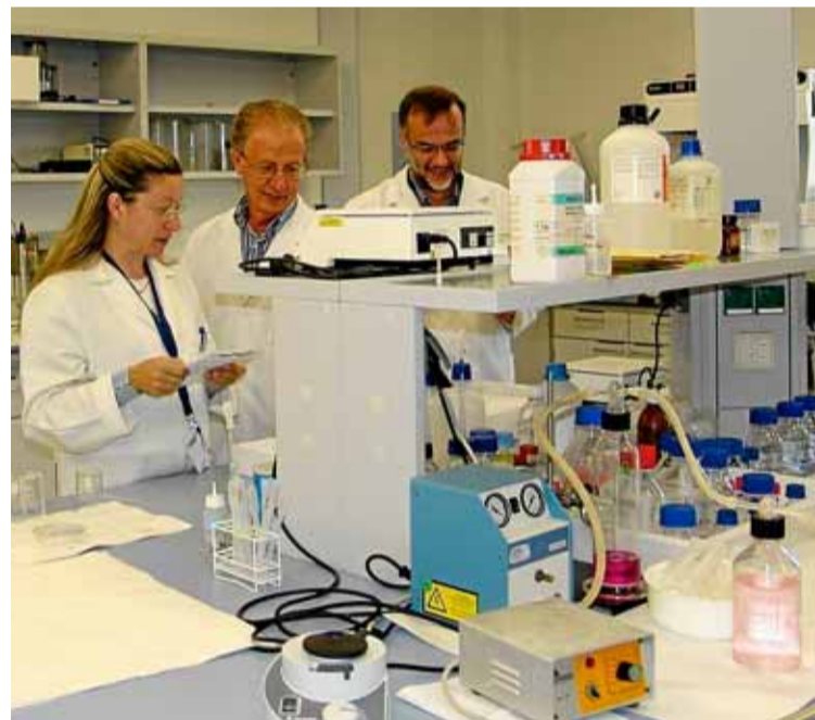
Laboratorio de Litiasis renal en el IUNICS.