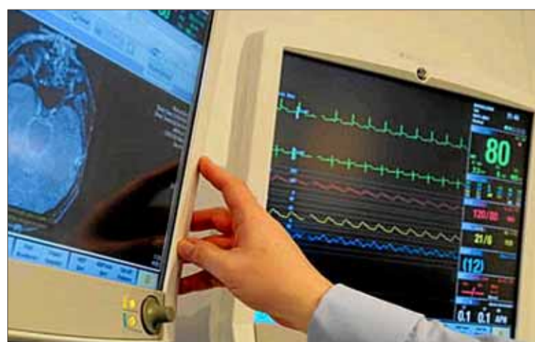
Equipo de motorización móvil que permite seguir las señales a distancia.

Estos equipos se concentran generalmente en áreas del hospital muy especializadas en situaciones críticas (UVI, Urgencias o quirófa-